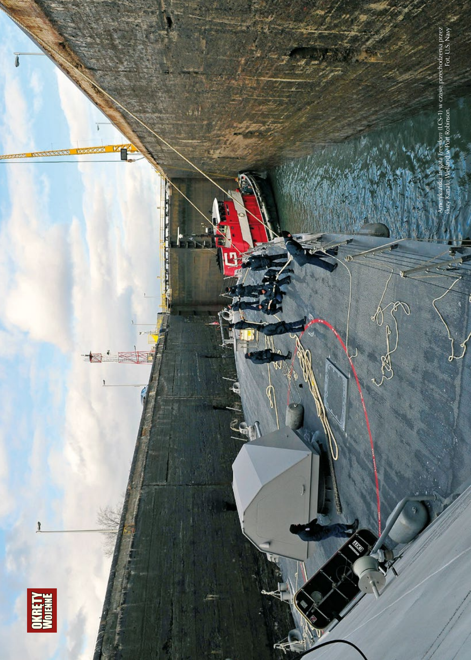
Amerykańska fregata Freedom (LCS-1) w czasie przechodzenia przez służby Kanalu Welland w Port Robinson.