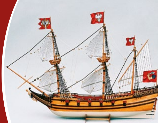
Pinka „Panna Wodna”

Magazyn miłośników spraw wojennomorskich