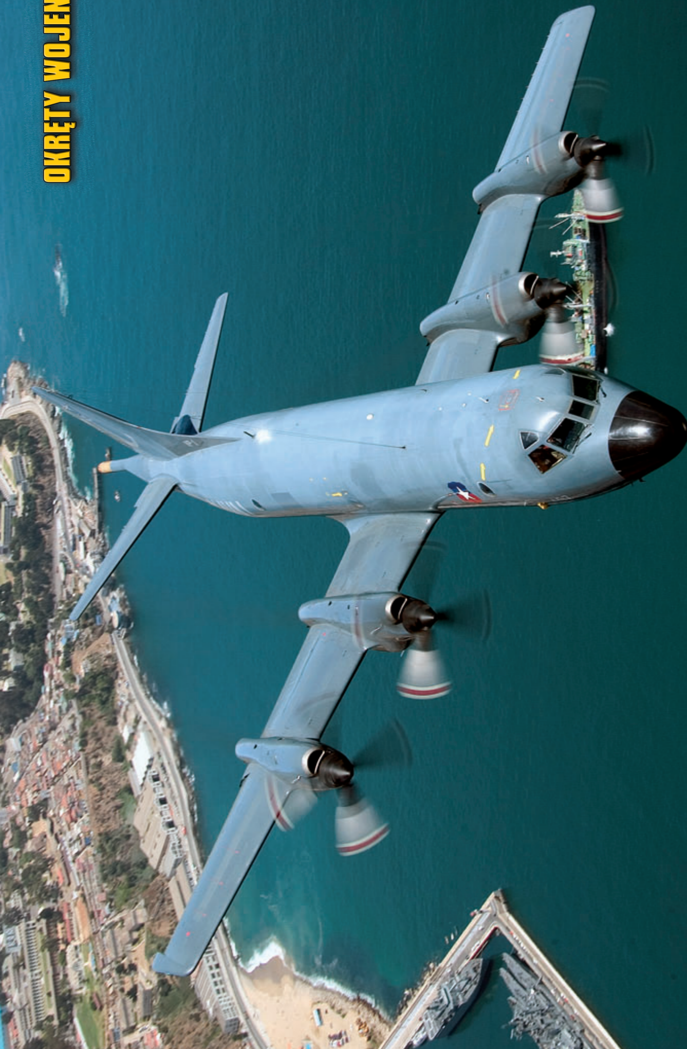
Chilijski samolot patrolowy Lockheed Martin P-3ACH „Orion” w locie nad bazą morską Valparaíso.