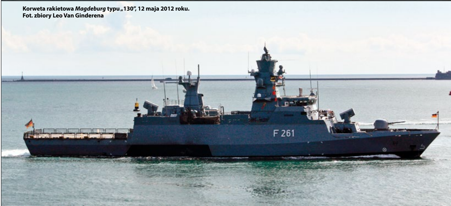
Korweta rakietowa Magdeburg typu „130”, 12 maja 2012 roku.