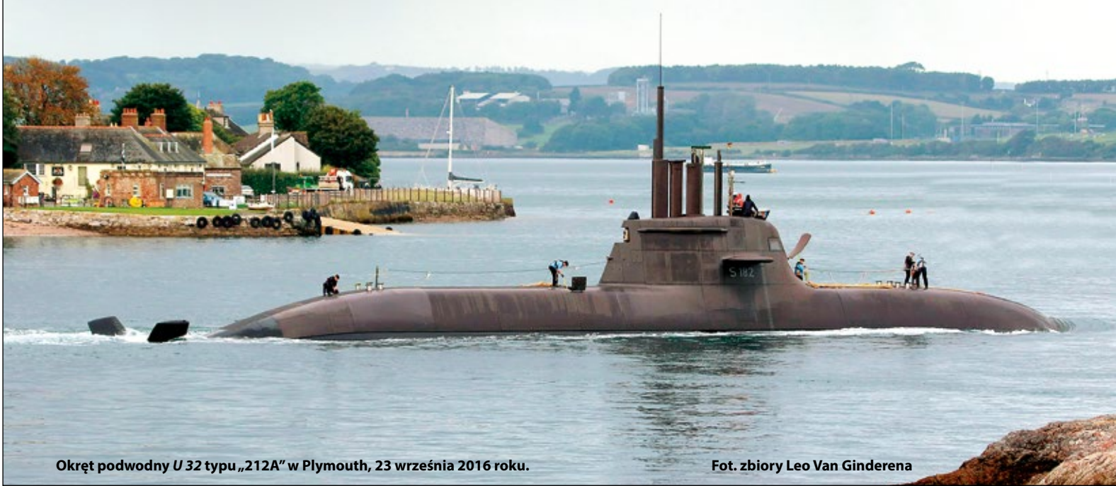
Okręt podwodny U 32 typu „212A” w Plymouth, 23 września 2016 roku.