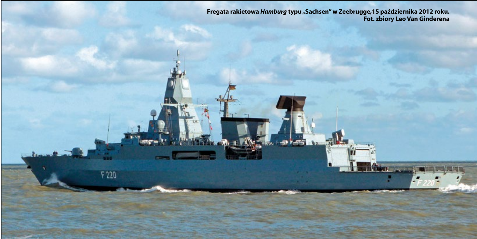
Fregata rakietowa Hamburg typu „Sachsen” w Zeebrugge, 15 października 2012 roku.