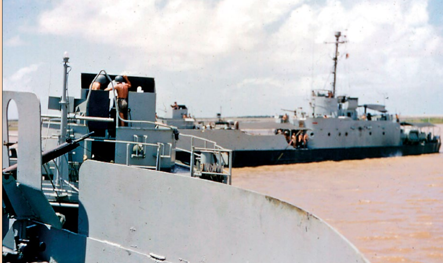
Spotkanie ciężkiego tonażu Dinassaut – dwóch LSIL na Rzece Czerwonej w 1954 roku. Na fotografii okręty o numerach bocznych 19029 oraz 19033.