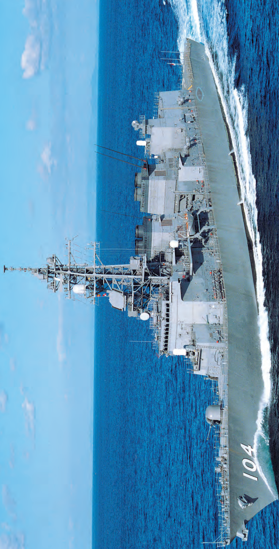
Japoński niszczyciel rakietowy Kirisame