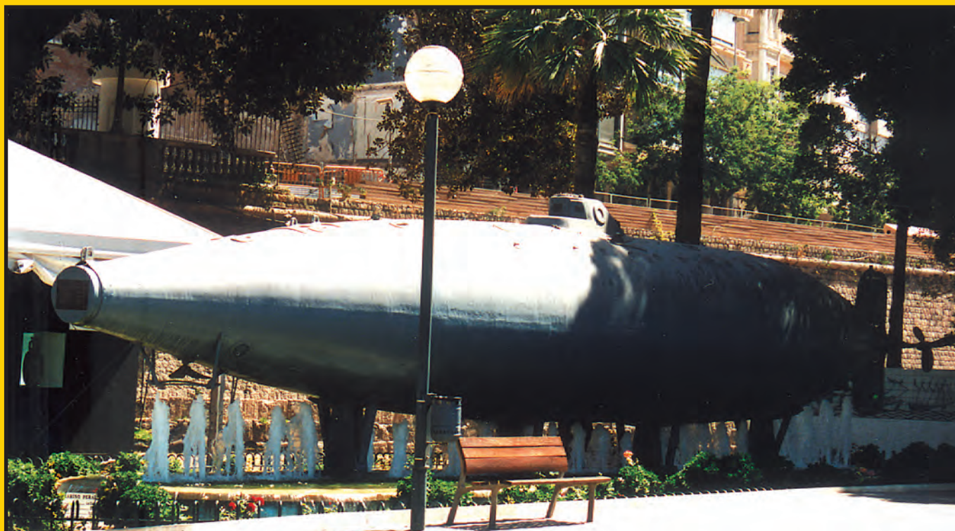
Ogólny widok okrętu podwodnego Perala zachowanego jako pomnik w Kartagenie.