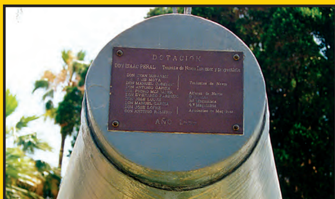
Tablica pamiątkowa na pokrywie wyrzutni torpedowej ze spisem załogi okrętu.