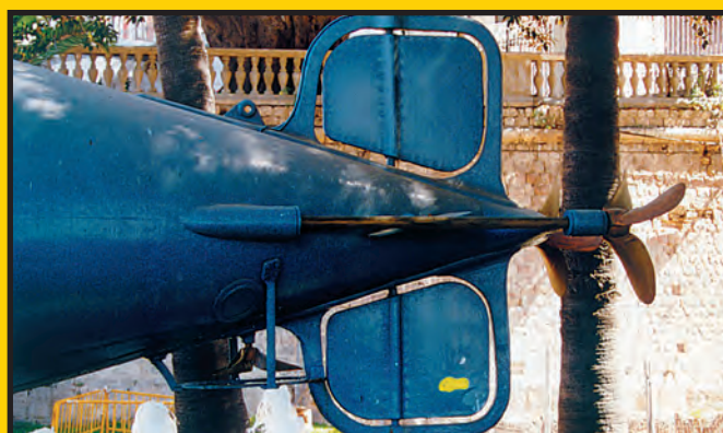
Ster pionowy, śruby silników marszowych oraz rufowa śruba głębokościowa.