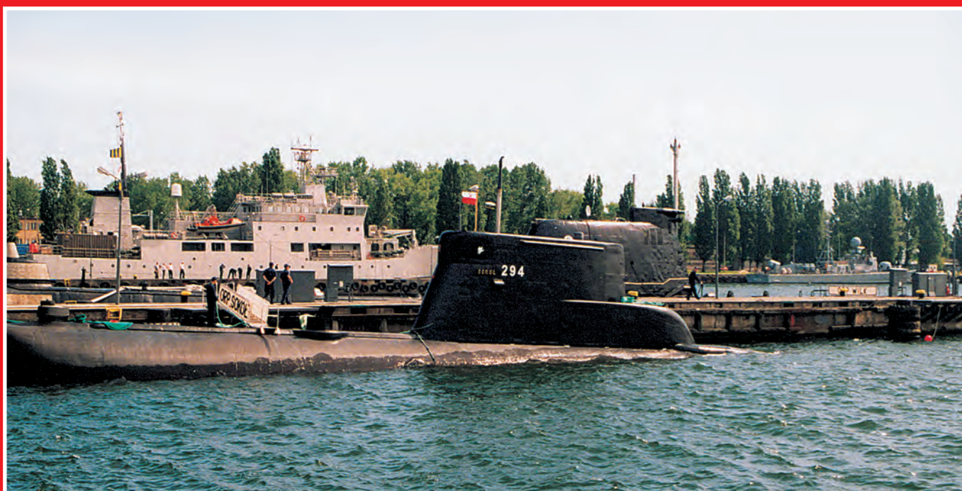
Stord jako Sokół już pod białą-czerwoną banderą.