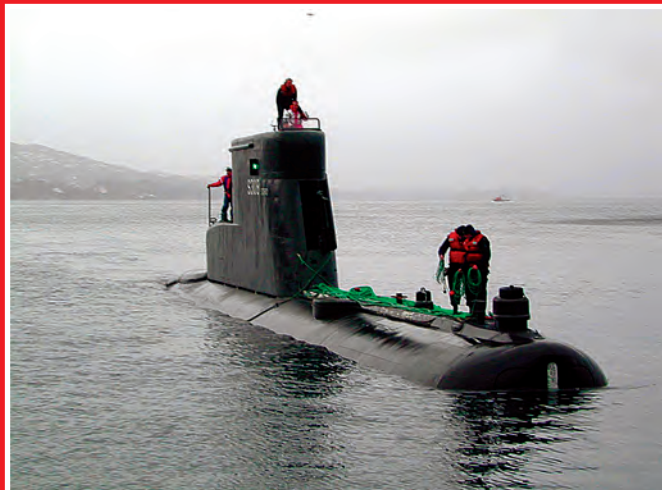
Kierunek — Morze Norweskie.