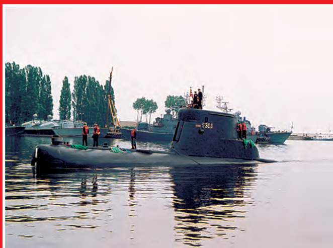
Stord wpływa do portu Gdynia-Oksywie.