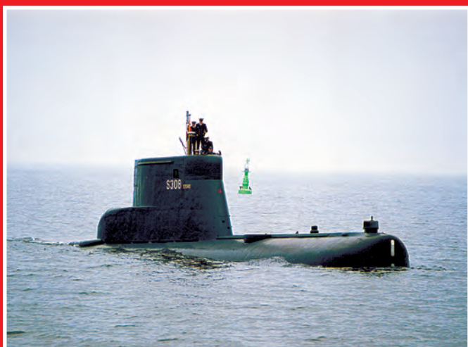
Stord na Zatoce Gdańskiej.