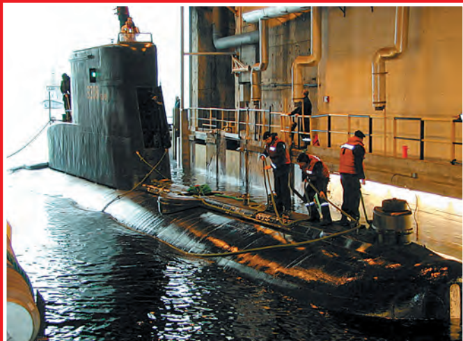
Stord opuszcza schron w Bergen.