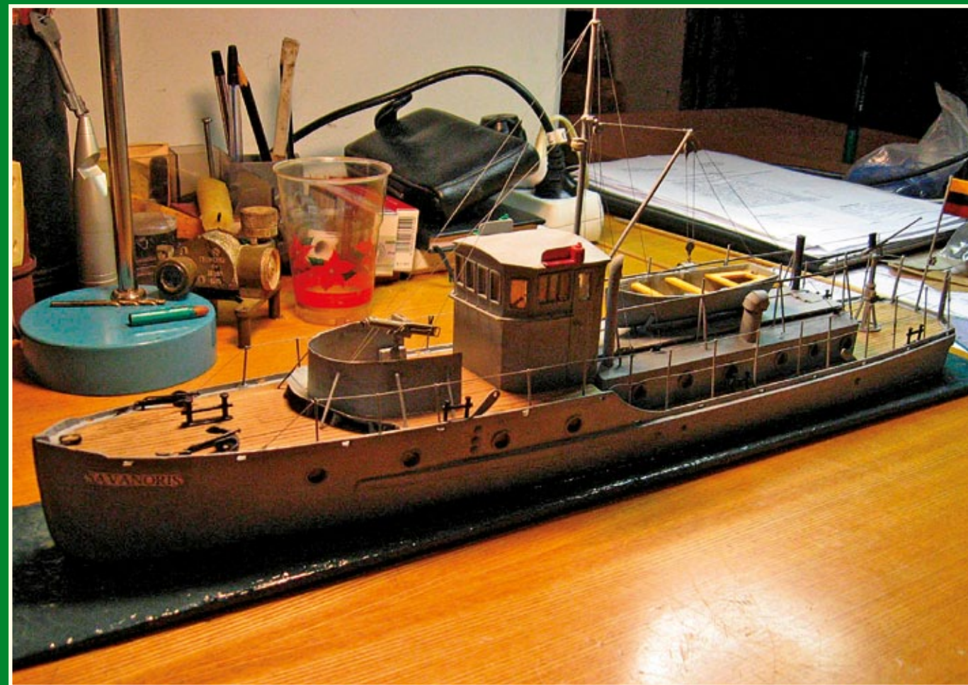
Dwie interesujące fotografie modelu litewskiego patrolowca Savanoris .