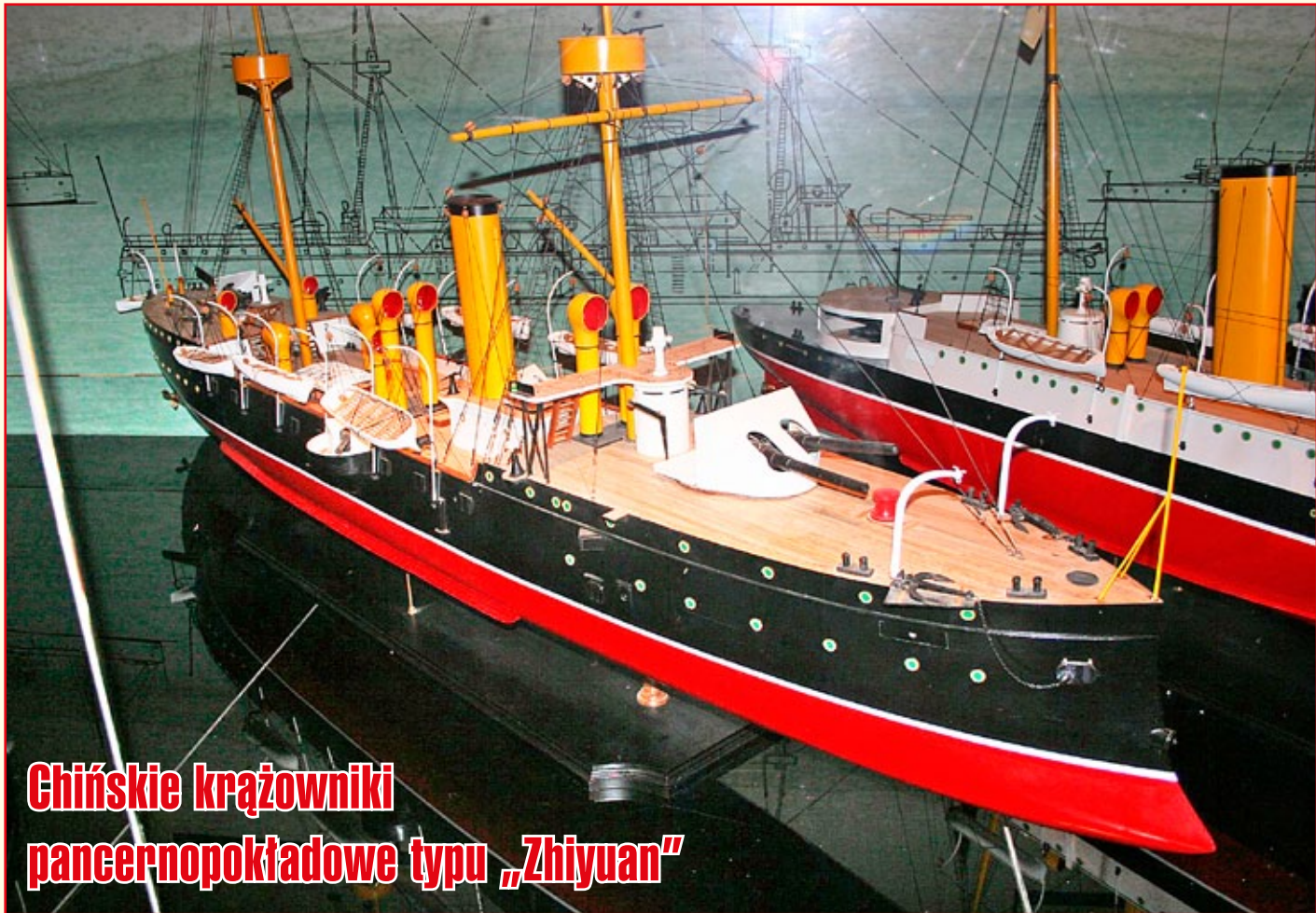
Chińskie krążowniki pancernopokładowe typu „Zhiyuan”