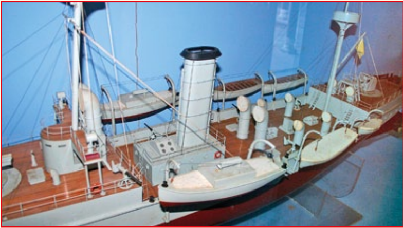
Model krążownika Zhiyuan znajdujący się w byłych pomieszczeniach sztabu Floty Północnej na wyspie Liugongdao.