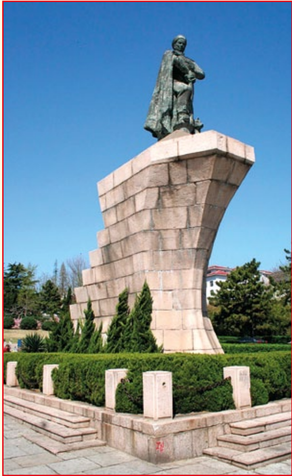
Pomnik Den Schichanga w Weihaiwei