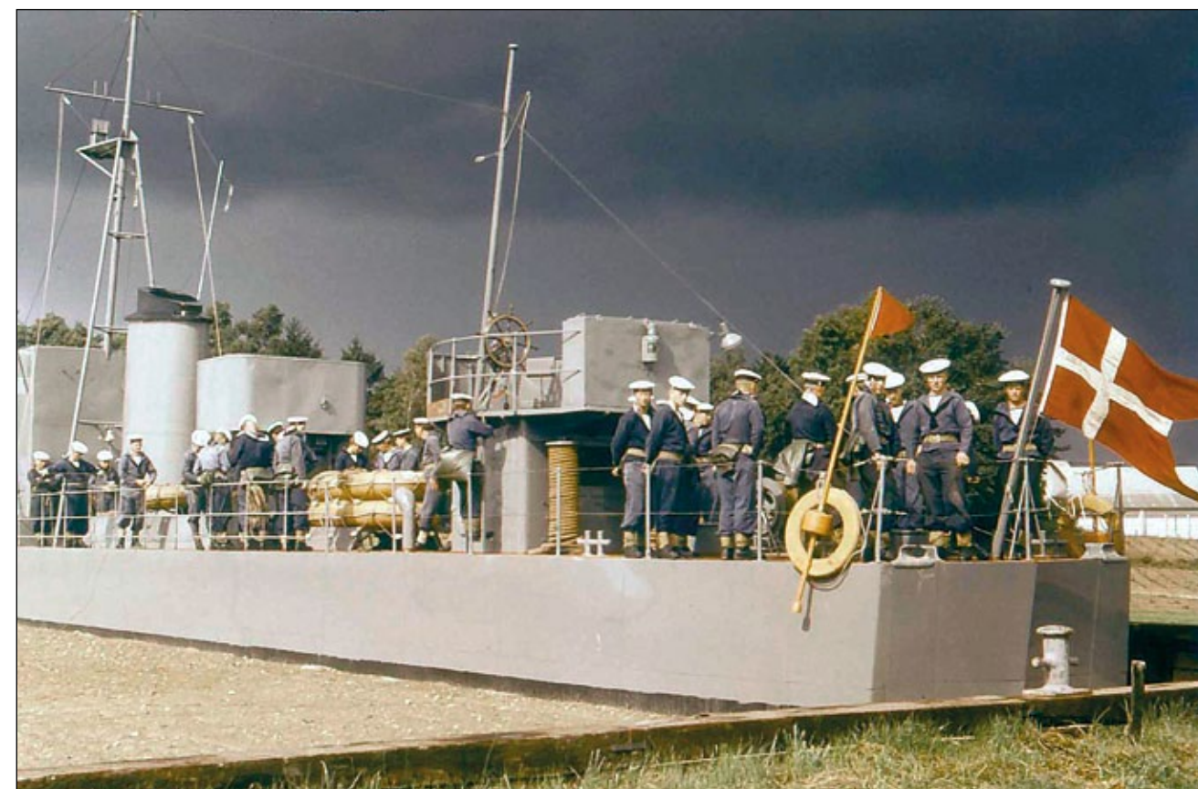
Poborowi poznają prawa drogi na morzu na pokładzie LAPPEDYKKERENA w 1960 r.